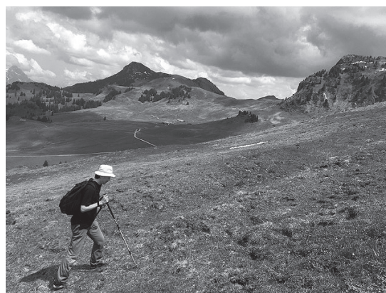
Hochetzkogel 山を登る(於 オーストリア・キッツビューエル)

私はドイツに滞在する為に許可証を申請したのであろうか。それとも許可証を申請する為に当地に滞在したのであろうか。